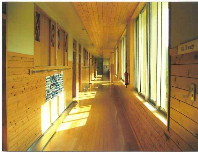
木のぬくもりが感じられる校舎内