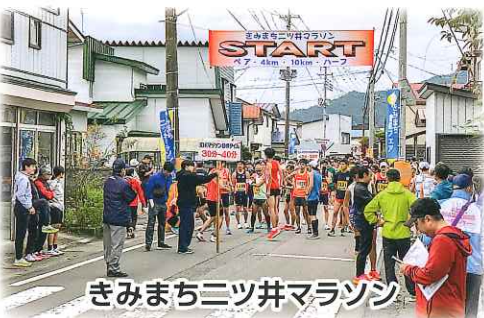
きみまちニツ井マラソン