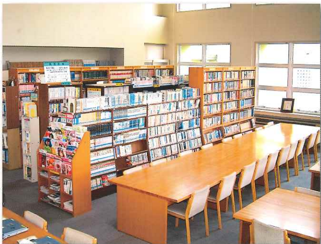
明るく開放的な図書室