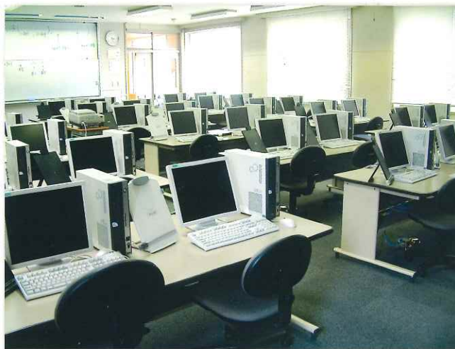
設備のゆきとどいたコンピュータ室