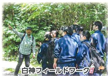
白神フィールドワーク